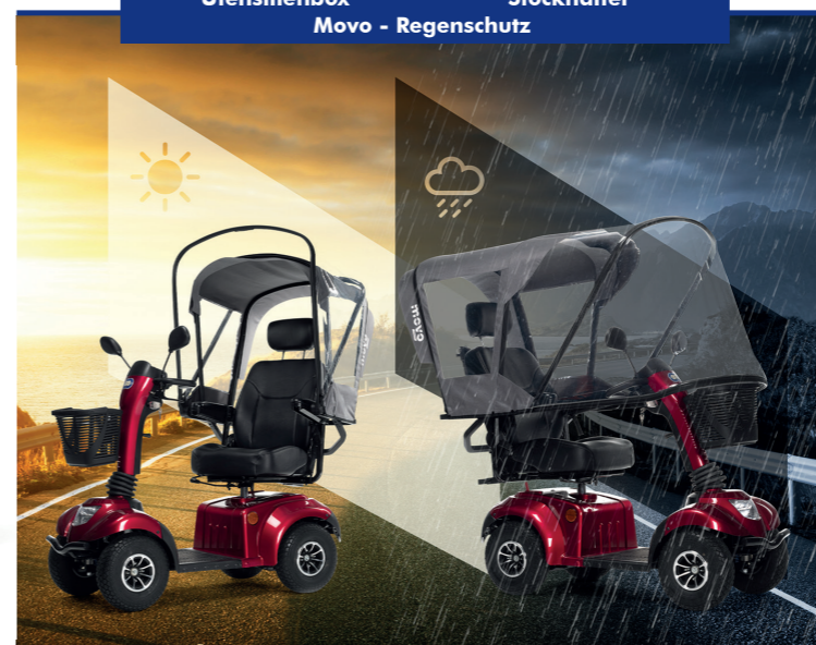
Movo - Regenschutz