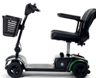
ONE+ Mit einer 25Ah-Batterie ...